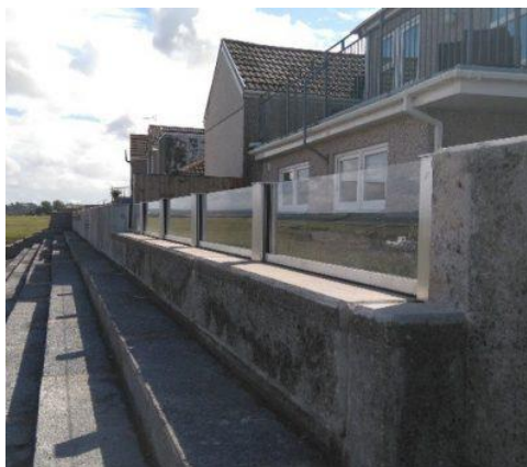
Slika: Primer steklenih elementov v visokovodnem zidu.

Na odsekih, kjer je zid visok, je mimo objektov predvidena v zgornjem delu steklena stena (nad višino zidu 1,50 m) – steklena zaščitna pregrada po sistemi kot. npr IBS Technics. Zaščita se postavlja v vnaprej pripravljene odprtine AB zidu. Material zapornih elementov je večplastno lepljeno steklo, skupne debeline min. 55 mm. V utore se namesti vertikalna in horizontalna tesnila (EPDM). Pritrdilni elementi so iz nerjavnega jekla V4A. Pritrdilne plošče vmesnih stebrov so iz nerjavnega jekla SS 304, vmesni stebri pa iz aluminija EN AW-5053-T6.